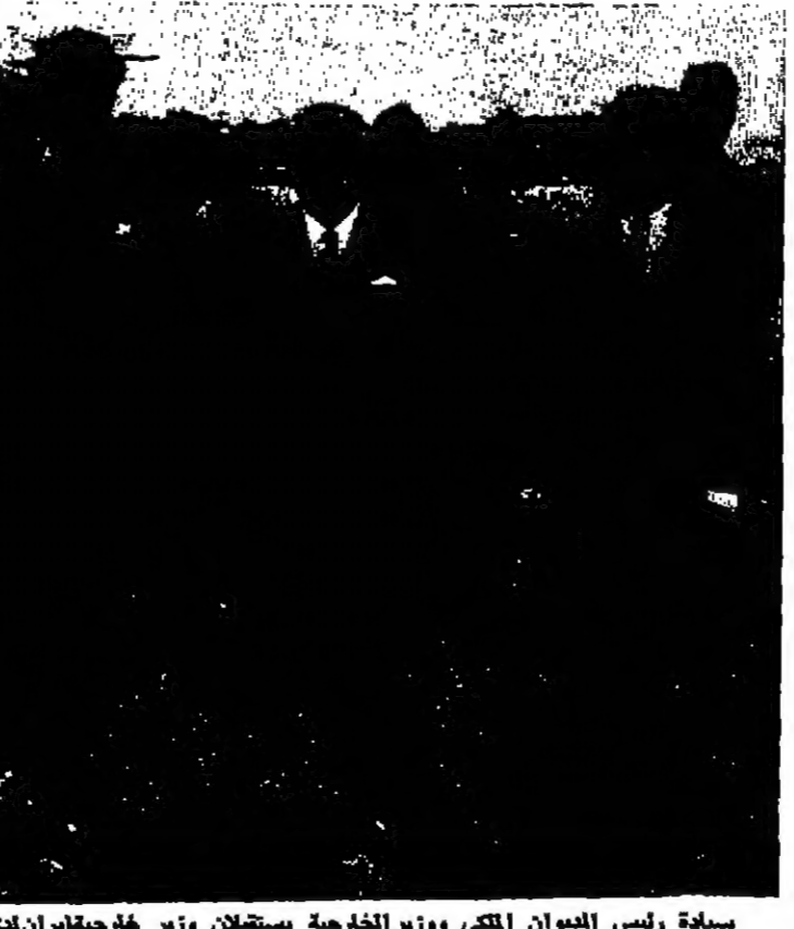
سيادة رئيس الديوان الملكي ووزير الخارجية يستقبلان وزير خارجية إيران لدى مروره بمطار عمان أمس

عمان - ترأس سمو الأمير حسن نائب جلالته الملك ولي العهد المعظم اجتماع مجلس الوزراء الذي عقد مساء أمس في قصر بصرى بعمان . وأصدر الاجتماع تصريحاً السيد عبد القم الرفاعي فوجئت الأمانة الملكية في الاجتماع بن الحجاب الأرضي التي ترمز بروز وزير الخارجية الإيراني بطار عمان لتستعرض معه الموضوعات التي تهم